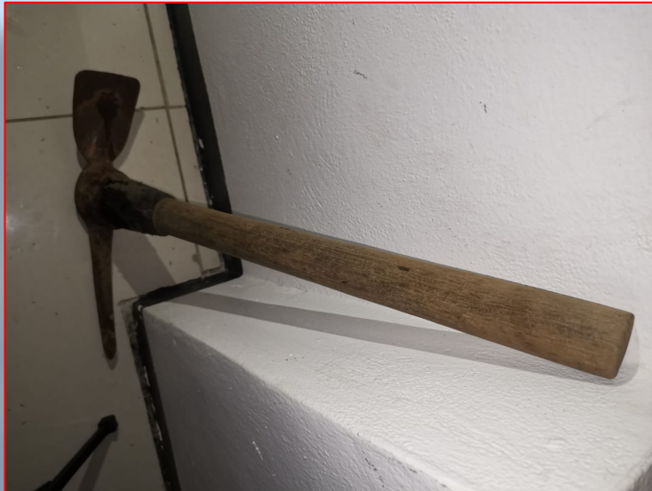
Objeto contundente (piocha)